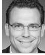
*CFA Senior Consultant PPCmetrics SA

Il est premièrement utile de rappeler qu'un élément central dans la gestion des caisses de pension est la réserve pour fluctuations de valeurs. Cette dernière permet d'absorber les