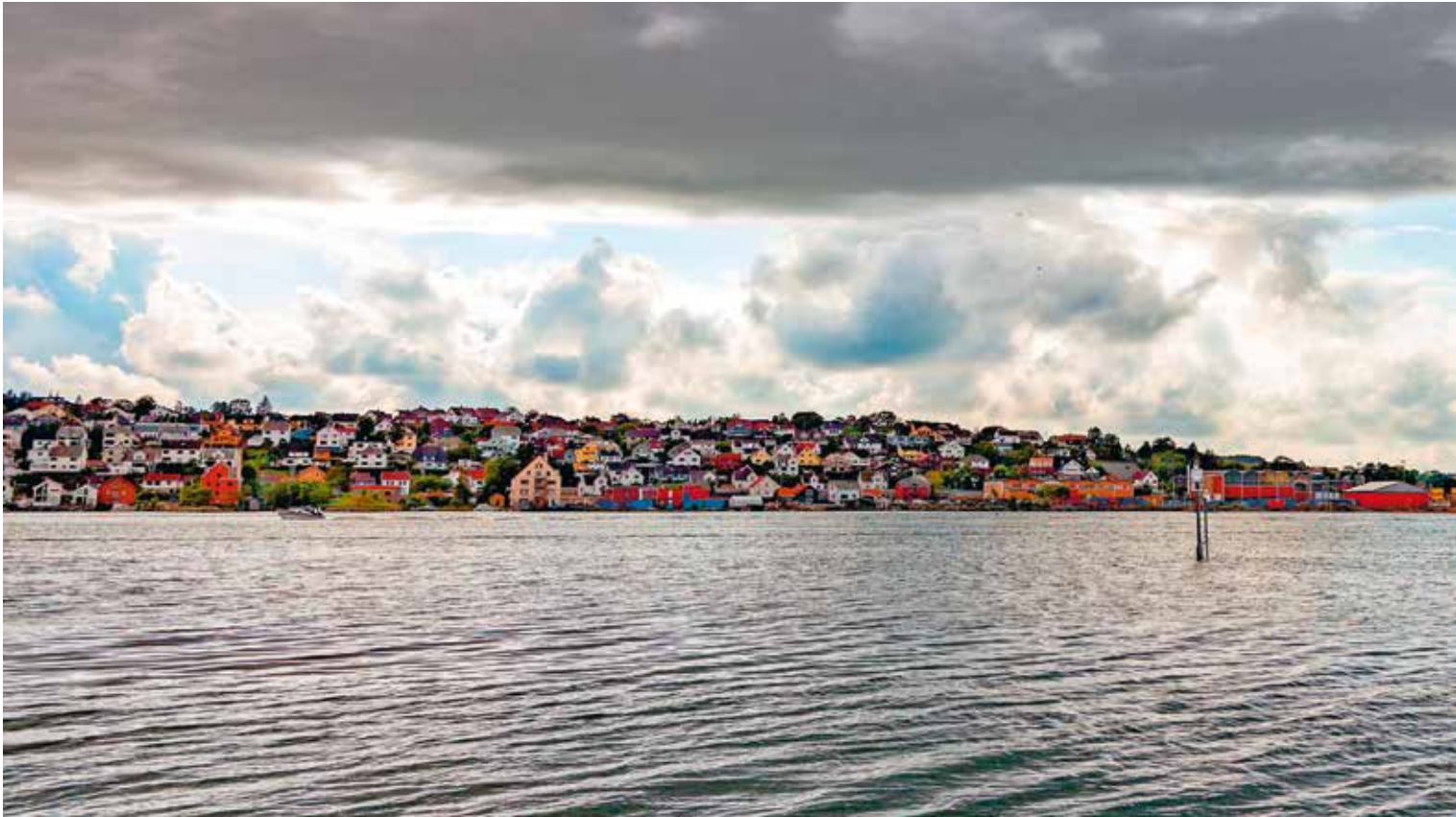
Erdöl- und Gasexporte sind die wichtigste Einnahmequelle des norwegischen Staatsfonds. Bohrinsel vor der Stadt Sandnes.

rückläufigen Einnahmen aus den versiegenden Erdölquellen dereinst wettmachen können.